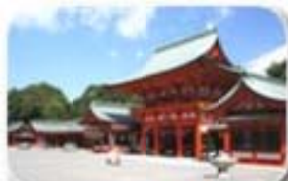
大津市にある天智天皇(中大兄皇子)を祀る近江神宮楼門

大和朝廷の祖国は 日本列島それとも 朝鮮半島? 63年の白村江の大敗後、中大兄皇子は64年に唐・新羅の来襲に備え、対馬・吉岐・筑紫国に防人と烽(火のろし)を置き、大宰府の防衛のため水城を築きました。さらには飛鳥から近江に都を移し