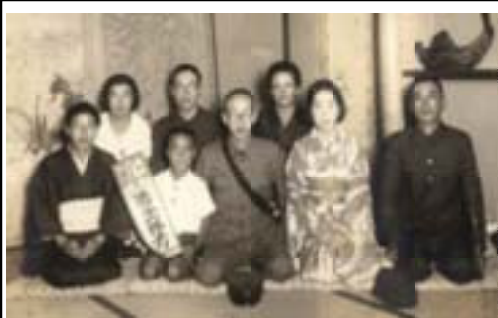
昭17年7月・写真の前列右端が祖父隣は母、父(中央)私(小3)、祖母の順祖父との唯一現存する家族写真

私は六年生、縁故疎開で、我が家の出生の炭山にいたが、夏休みで8月15日より前に「家」に戻っていた。戦時中にと、祖父は充分な栄養が取れず目が見え難くな