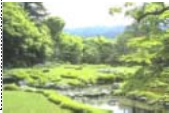
南禅寺近くの無鄰菴は、明治太正の元老・山県有朋公の京都の別荘

任期で入院したアベさんがお辞めに、2008年の9月は「あなたとは違うんです！」とフクダさんが辞め、2009年の9月は「ミゾーユー」のアソータローさんも。その後、政権交代をした民主党の八トさんは、2010年6月で辞め、後を継いだカンサンもついに8月末にお辞め？とか。長過ぎも困るが、早代わりは芝居の世界だけにしたい。