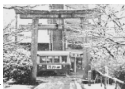
雪の日、安井金比羅宮の 鳥居の向こうを市電が行く

鳥居が見えるというのも、市 電沿いでは、ここだけではな いでしょうか。 右にある鳥居をくぐると、 なだらかな坂道が始まり、高 台寺、霊山観音などへ続く、 祇園の観光コースとなります。 左にある鳥居には「悪縁を 切り、良縁を結ぶ祈願所」 の文字が。ここは、縁切り の名高い安井金比羅宮です。 鳥居をくぐると、細長い参道 が続きます。やや奥まったと ころに、本堂が見えます。東 西に細長い境内ですが、市街 地化する以前は、もっと広い 境内であっただろうと想像さ れます。