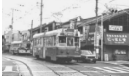
東山安井に着く市電

清水道 を出た市 電は、相 変わらず自動車に囲まれなが ら、東大路通を北上します。 商家・民家の混在した街並み が続きますが、次第に観光客