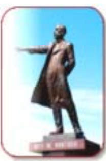
北海道開拓の父「ウィリアム・スミス・クラーク博士」像

「Boys Be Ambitious」少年よ大志を抱け」で有名な「クラーク博士の言葉をお借りしオールドボーイズ&オールドガールズ、ピ、アンビシャス! まだ若い!。終ります。