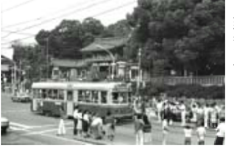
祇園はいつ行っても人が多かった。市電が消えようとする日、乗り納めの人たちで大賑わいだった。

東山安井を出た市電は、ゆるい下り坂に掛かります。車窓から見える家並みにも、賑やかさが出てきました。そして、進行右手、こんもりした杜の緑の中に八坂神社の朱色の西楼門が見えてきました。祇園に到着です。