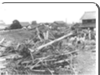
上の写真は、昭和28年南山城大水害の井町。東の山腹の正池が水に襲われ、井町が水に襲われ、井出町だけで死者107人が被害の姿は今の東日本大震災の津波と同じです。町は川より低い地形で家屋、人、牛も水に浸かり10日程はそ

記は学び、市外郭団体の経営指導をする部門のバイト経験もあり帳簿を見ればある程度判断できると相談したのでしよう。前号の横領事件の影響で2年続きの赤字、今年も続きそう。借家は麦酒会社に、店