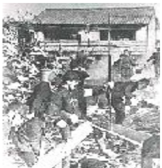
写真・下、爆撃の被害家屋から罹災者を探す警防団の人たち