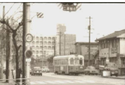
二条駅前に到着した北行きの市電