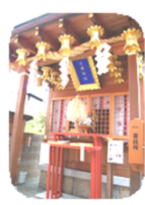
三嶋神社の境内には、うなぎ業者の参拝者も多いらしい。

現在も皇室とのつながりがあり、秋篠宮殿下が2度参拝されるなど皇室の子宝祈願にも「役買」している。(おしのび?で参拝された時お姿を編集者も拝見した) また、神社は、うなぎを神の眷属として信仰し、江戸期より神社に伝わる「禁食鱺文書」には、祈願中は、氏子は、うなぎを禁食する旨の記載があるとか。が成就(子宝が授かる)した後は、うなぎを食べて体を労わるとの説。家長た