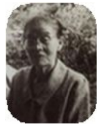
私が金料 玉糸にし ている亡 き祖母の 言葉一つ

第一次石油ショックがおさまりがけた頃です。今の宅急便の元の「フットワーク」もそのころ出ました。この小耳話も大ヒントになりました