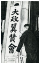
大政翼賛会 取上げてこの文を書きました。

生まれのお方なら「とんからりん」が何処から引用したかは「存知の隣組」お笑い三人組(天竺総合テレビ)につかわれました。戦時中、国民学校生だった私達の世代では、今も同窓会で良く歌う一つです。歌詞は、下記のとおりです。