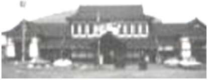
和風駅舎の二条駅(市電廃止後撮影)