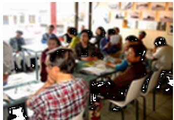
朝粥会は定員40人満席でした。

日本から3時間足らずの威海の地図や現地の生徒さん、お住みになっていたお部屋の写真など、現地の様子ができるような資料をお作りになって、生徒達との楽しい生活のお話をききました。