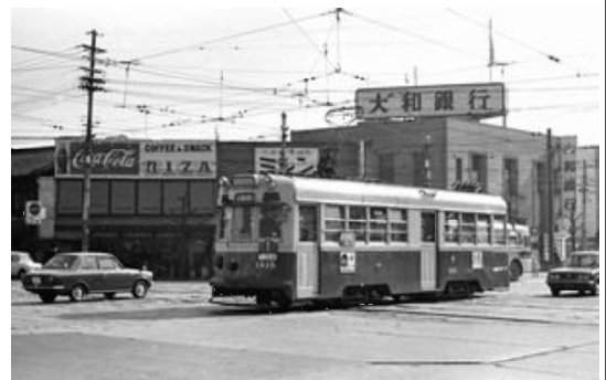
千本丸太町北で発車待ちの市電、周囲は商店が多くなる