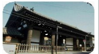
三十三間堂南大門 (重文)

東寺の元の南大門は、楼閣だったそうだが、明治初期にの火事で焼けたために、教王護国寺(東寺)の南大門として、明治28年(1895年)当時のお金700円で、三十三間堂の西門を移築したものです。この西門は慶長6年(1601)に豊臣秀頼によって建立された切妻造本瓦葺、二間一戸の雄大な八脚門で、官立寺院として重文にふさ