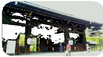
東寺の南大門 (重要文化財)

付近から東は道幅が少し広がり、付近は「西の門町」との町名がついている。子供のころから何故だろう疑問をもち、ヒョットしたら七