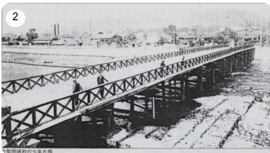
2 市電が通る前の七条橋