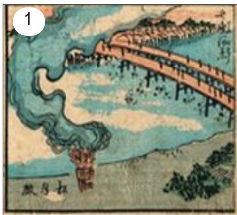
1 江戸時代：松明殿も描かれている