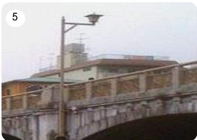
5：今の七条大橋 味気ない照明柱 99年の垢で、キツウ汚れたなあ！！！！