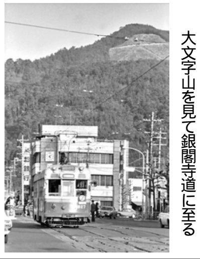
大文字山を見て銀閣寺道に至る

大文字山の麓を通り、高野、下鴨から堀川へと流れる分流です。観光名所の南禅寺水路閣や哲子の道は、この開通によって生まれました。琵琶湖疏水は、現在でも活用されるほか、哲子の道から北白川、高野と北上する疏水沿いの敷設路は桜の名所としても知られます。京都市電線に、桜の名所はいくつかありますが、ここは市電の間近にあれば「前」となり、一段高いところに桜があるため、高差のある写真が撮れるといつ、他とは違った撮影ができました。今出川通は上りとなり、ほぼ水平の疏水分線と、次第にその差が縮まってきて、両者が同一面になる「銀閣寺」でした。私自身の銀閣寺道の思い出と、市電乗客の大部分は、車内はくつき、あわてて、銀閣寺道の電停まで空きます。まっすぐで走り、赤色表示になった最終電が東へ行くと、東山車に乗り込んだものでした。百万文化の代表とも言う、遍方面に、車体を振り振り、坂を登り、大文字山へ登るんだ街並みが流れていました。四登山道もあり、ハイ十年も昔の微かな思い出がよみがえりました。