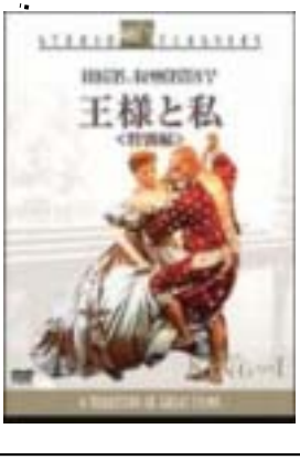
監督 ウォルター・ラング 出演 ユル・プリンナー デボラ・カー