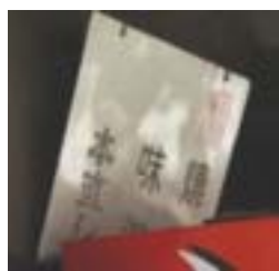
写真は、寶酒造時代のホーロー看板です。

転記・・・古典落語とお酒のオーソリティーの米二師匠のホームページだけ有って、最近増えた新米の酒屋がしらない「直し」を正確にご存知でビックリです。勿論落語のことも色々とお書きになっています。桂米二で検索ご覧あれ。