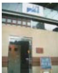
「酒場酒座・陣・写真上・今も営業中」を共同

そこで、ファミマの契約改定の際、平成5年(1993)店の奥に別の酒専門店をも設ける交渉を強力に進め了解を得て、奥横の空地にビル増築し倉庫を移し広げた場所に酒専門店つくる計画を始めました。同時進行で、各地の銘酒を扱い、三増酒を排斥している「京晴グループ」の仲間の勉強会で、日本酒の級別廃止や酒販売免許はなくなるだろうと予想。夫々が個別では酒屋を続けられない時代がくる前に合併を目指そうと、第一歩として上京区で「西陣屋・酒