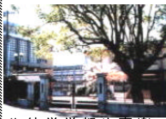
集西 の仕 事を始 め、京 都女子 学園の 学生生 徒さん や関係

古き都に咲きし 花の命は 祇王の夢ならずや 常磐ならずや さらば吹けよ みね吹く風よ 吹きて悲しみの 歴史をかえん