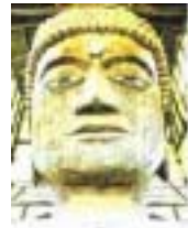
写真は天保年間(1830年)〜1843年(に、現在の愛知県の人々が、大仏の肩より上部分を木造で造り寄進したもので、豊國神社北側、方向寺の東にあつた「大仏さん」。写真はホームページより無断でお借りしたものだ。注釈に自分の色をつけたとあつた。私の記憶では木肌が見え目元