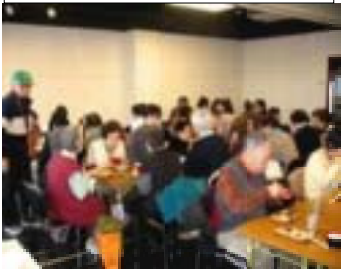
ご参加多数で【楽々ホール】で朝粥を食べていただいた。