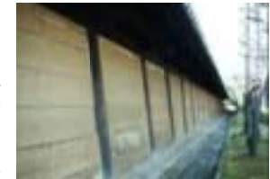
倒壊し慶長3年(1626年)に秀吉公が死去後、豊臣秀頼が秀吉の遺志を継いで、今度は木製ではなく、銅製の

大仏殿の建物は、高さ約49メートル、幅約88メートル、奥行き約54メートルといわれ、現存する東大寺大仏殿(高さ約49メートル、幅約58メートル、奥行き約50メートル)を凌ぎ、この規模は、2000年の発掘調査により実証