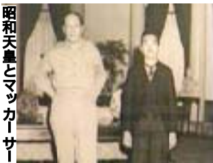
昭和天皇とマッカーサー元帥(左)と中国でも

私(日本人の多く)は、日本の象徴で年長者である天皇に日本の礼儀であるお辞儀をされたオバマ大統領に好感を持ちました。お迎えの天皇ご夫妻の微笑みも心から歓迎のお気持ちを表