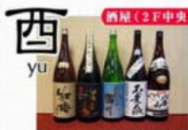
◎大正2年(1913)創業の酒屋・西(ゆう) 店の歴史・西陣の銘酒・焼酎・サイダーなどが揃っています。試飲も地元産品も揃います。