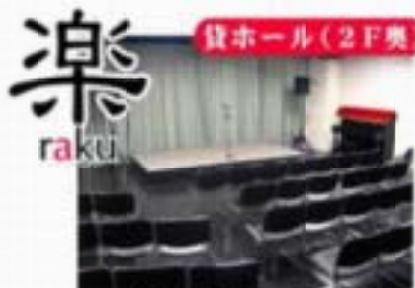
◎多目的使用の貸ホール・楽(らく) 62㎡(60人収容可) 懇親会、音楽会、講演会、会議、パーティー・・・ 多目的使用可、お電話はかかれます。

募集定員：25名様：2月28日(日)て締切 近鉄・京都 檀原神宮前住復1720円は各自で