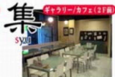
◎ギャラリー/カフェ・集(しゅう) 1Fファミマのお客も、お飲み物に寄り添いながら、ギャラリー、プチライブ、会議など多目的利用可也。